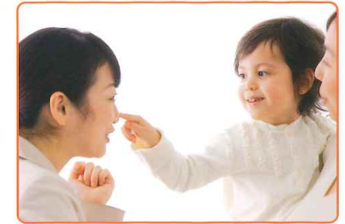
▶ 教師と1対1のプライベートレッスンなら、興味や個性にあわせた学習ができます