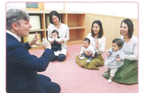
満6ヶ月から良質な英語にたっぷり触れることで 日本語と同じように英語も体得していきます。