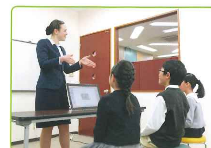
ネイティブとの対話を通じ英語圏の文化も知ることができます