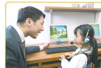
インタラクティブコースでは、一人一台ずつパソコンを使って個別に学習