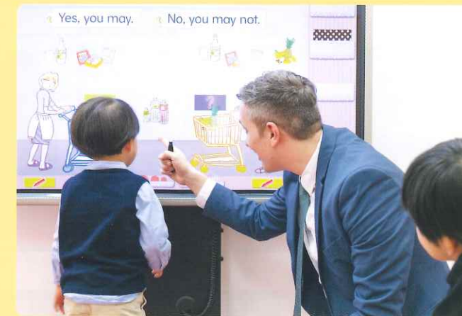
よりアップテンポなレッスン展開で、学習への集中を高め発話量も増やせます

アミティーの「i Lesson®」は、長年に渡る教育ノウハウから生まれたオリジナル最新ITレッスン！大画面タッチパネル式電子ボードを使った「i Lesson®」は子供たちが楽しみながら英会話を学べるアミティー独自の授業形態。「i Lesson®」の授業が待ち遠しい！と夢中になるお子様もたくさんいます。すべての教室で受講可能ですので、ぜひ一度ご体験ください！