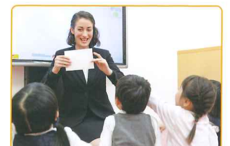
外国人教師のプラクティカルコースでは、実践的な会話表現をdrillingなレッスンで確実に習得