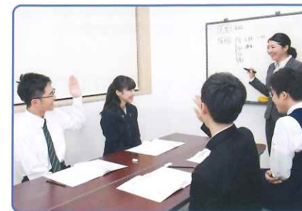
レベルや進路に応じた少人数グループ学習だから密度の高いレッスンが可能です