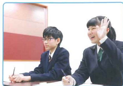
学校英語や資格取得、高校入試などで実力が発揮できる総合的な英語力を養います