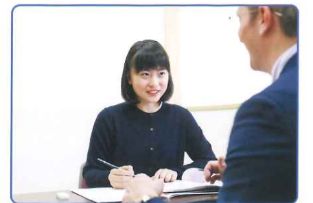
長所や弱点を熟知した担任教師と密度の高い学習ができるプライベートレッスン