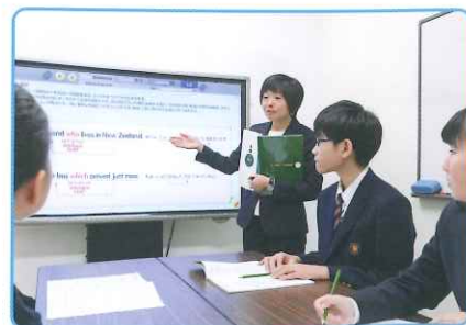
実力に合わせてレベルの高いレッスンを展開