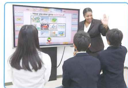
ネイティブとの実践的な会話訓練とともに異文化に触れるプラクティカルコース