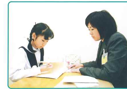
アミティーではTOEIC Bridge®で85%以上をクリアできた生徒にはTOEIC®L&R受験を推奨しています

英語圏の短大・大学への留学志望者を対象としたTOEFL®で、志望大学に必要なスコア獲得を目指します。アカデミックな英語力が問われる試験に照準を定めた、効果的な対策指導を行います。