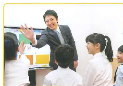
基礎的なコミュニケーションのスキル・知識を身につけます。