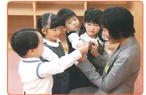
▶ 日本人教師のきめ細やかなケアで、確実な理解と定着を図ります