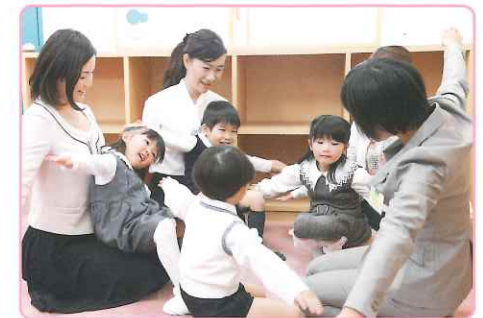
大好きな保護者の方と楽しく学べる「母と子のクラス」は お父さま・お祖母さま・お祖父さまもご参加いただけます。