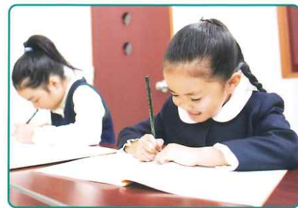
出題傾向に即した学習や語彙・文法面の整理など英検®受験のポイントを習得します

GOLD・SILVER・BRONZEの各グレードや、年齢・レベル別学習をプログラム。単語・表現の理解を固め、また低年齢のお子さまはマークシートへの記入練習も行って、受験準備を万全にします。