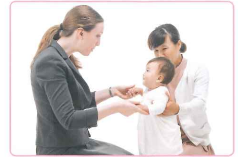
落ち着いた環境のプライベートレッスンなら 人見知り気になる時期のお子さまも安心です。