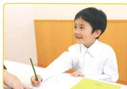
「聞く・話す・読む・書く」の4技能をバランス良く高めます。