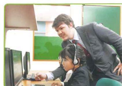
インターネットを活用して海外情報の検索・収集や英語でのメール交換も行います