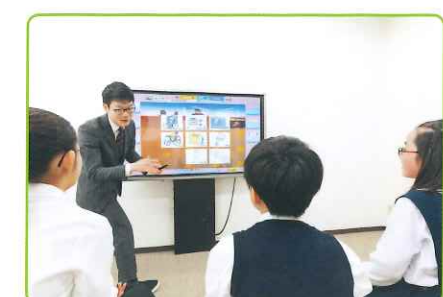
レギュラーコースは日本の生徒の学習特性を十分に理解した日本人教師が指導