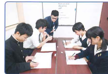
実用英語クラス・文法クラスでは大学受験や資格試験にも対応できる総合力を養成