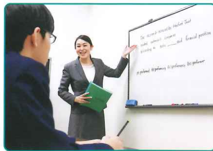
幼児や小学校低学年から高校生まで、積極的に英検®取得にチャレンジしています