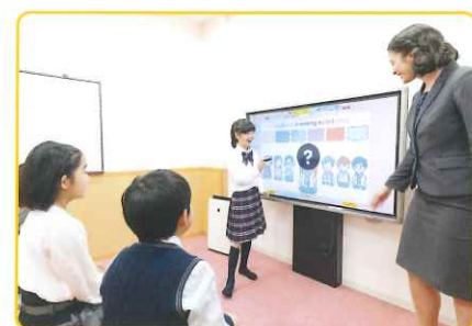
ネイティブの発音やイントネーションを聞き、正しい英語を身につけます。