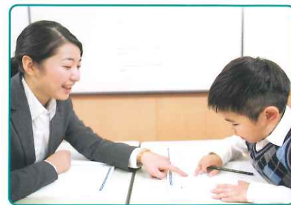
英検®Jr.は語句・会話・文章などの理解度も通知されるため継続的な受験で上達度が把握できます