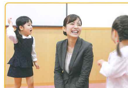
日本人教師が担当するレギュラーコースでは英会話の基本的なスキルを確実に習得

TPRとはTotal Physical Responseのこと。全身を使ってことばを体得していく方法です。例えば教師が“Stand up”と言って動作を示し、こどもたちがならうことでことばの意味を体感。見て、聞いて、理解し、反応し、吸収していくこどもたちの言語習得の原理をふまえた指導方法です。