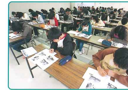
アミティーの特設会場で定期的にも実施しているTOEIC Bridge®IPテストの風景