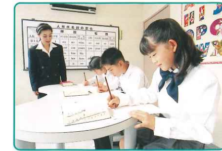
過去問題を使用した実践的な学習を通してTOEIC®L&RやTOEIC Bridge®でのスコアアップを目指します