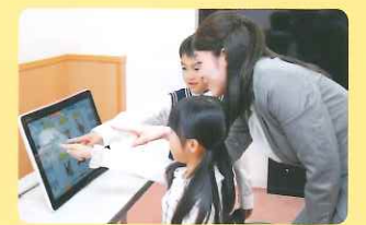
画面に触れると、絵が動いたり音が鳴り、楽しく直感的に英語を理解できます