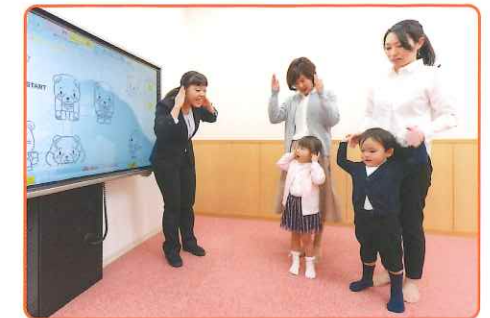
▶ Tots課程ではお子さま単独のクラスと保護者参加型のクラスが選べます