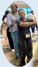
交流会： 大使や留学生 と楽しい 交流タイム

今回は、駐日マリ共和国特命全権大使を迎え、～もっと知ろう！アフリカ～とともに築く未来のためにをメインテーマとして開催します。アフリカは世界でもっとも「若い」大陸です。日本は年間100万人の人口が減少している中、アフリカの平均年齢は19歳で、2050年には世界の人口の4人に1人はアフリカの人になると予測されています。また、アフリカでは鉱物資源などの天然資源の宝庫であり、私たちの未来はアフリカ抜きには考えられない時代を迎えようとしています。日本とアフリカ、そして世界が直面する様々な課題について理解を深め、より良い未来を共に築いていくために何をしなければならないのかを、アフリカからの留学生、熊本の高校生が中心となって、分断ではなく“ともに未来を築く”という視点の大切さを考える機会になることを願って「アフリカの子どもの日」in Kumamotoを開催いたします。