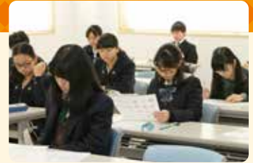
2024年度第1回英検 ® からの変更点

このうち、例えば1級～2級のWritingで新たに出題される「要約」問題は、長文を読み解き、その内容を約1/3の文章量に再構成する問題。解答するにはReading・Writingの実力や語彙・文法知識の統合的なスキルが必要です。このように、今回のリニューアルは、より総合的・実践的なコミュニケーションスキルを問うものとなっています。